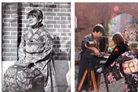
2019年度採択者の活動風景

活動プロセスを工夫して、参加者の創造性に寄り添う活動を行う個人や団体に対して助成金を交付します