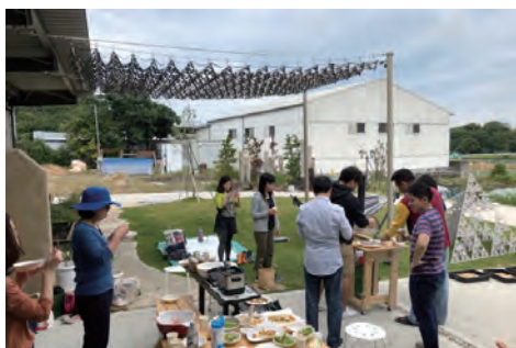
グループで収穫祭を実施した際の風景

何かをしたいあなたの想いを大切に、具体的なプログラムを一緒につくる複合施設【ことラボ】を運営しています